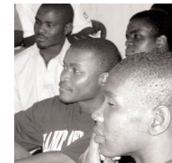
Celebración final en la Conferencia Nacional