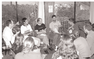
Estudiantes de los grupos de habla hebrea en una reunión

La Fellowship of Christian Students in Israel (FCSI) se creó en 1980 y fue reconocida legalmente en 1989. Desde entonces hemos vivido muchos altibajos. En la primavera de 2002 solo teníamos 4 grupos en activo, pero Dios es misericordioso y fiel. Él hizo renacer el ministerio estudiantil y el invierno del mismo año ya había 10 grupos en activo – 4 en hebreo, 4 en árabe y 2 grupos internacionales. Todos siguen activos en el presente y son dirigidos por estudiantes, con el apoyo de obreros. En total hay 200,000 estudiantes en Israel, y más o menos 100 estudiantes tienen lazos con FCSI.