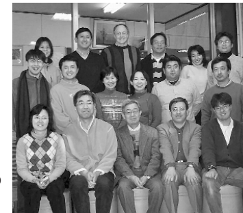
El equipo de obreros de KKG

Otpar por seguir a Jesús no es fácil para los habitantes de Japón. Menos del 1% de la población profesa la fe cristiana. La 'creencia' budista o sintoísta (religiones animistas) es parte de la cultura, tanto en el hogar como en la vida profesional. Hay empresas que tienen sus propios santuarios donde muchos de los empleados hacen sus oraciones para pedir por el éxito de la compañía, y la vida familiar está llena de ceremonias religiosas.