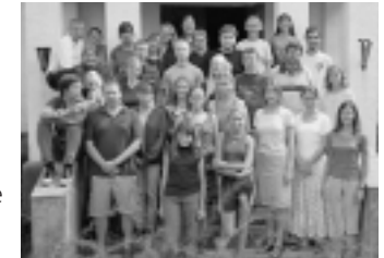
Campamento de verano 2002 (EEÜÜ)

Estonia ha estado frecuentemente dominada por sus países vecinos. Formaba parte del imperio ruso hasta 1918, y luego fue ocupada por la Unión Soviética desde 1940 hasta 1988. En 1998, con la independencia, llegó el capitalismo, la democracia y la libertad, pero aún sigue habiendo pobreza, y los índices de crimen y divorcio han aumentado de forma atroz.