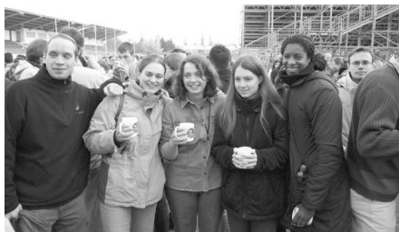
Estudiantes aprovechando de la conferencia nacional

Estudiantes y graduados que viven su fe e invitan a otros a conocer a Jesús en su vida diaria: eso es la visión de nuestro movimiento estudiantil en nuestra sociedad post-moderna, una visión que implica mucha creatividad y valentía.