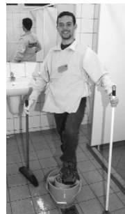
Ayudando en la conferencia de evangelización